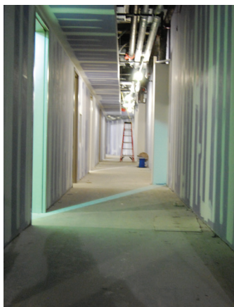
ARDEX Choice Contractor™ E.F. Marburger - Fishers, IN